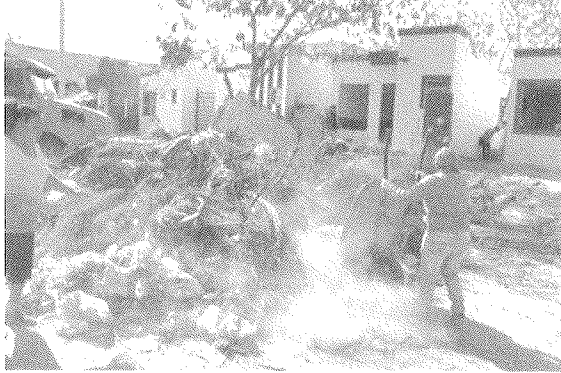
El ayuntamiento y la dependencia lanzan acuerdo para limpiar predios abandonados

México Feb 23, 2021 | Local | Tamaño de fuente